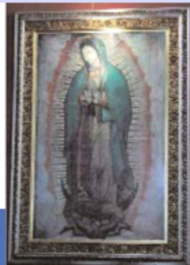
Santuario della Madonna di Guadalupe. In basso , il kanyon Sumidero, imbarco per una breve escursione. Nella pagina successiva un esemplare di coccodrillo e le cascate di Agua Azul

con il suo centro coloniale e del Monte Alban. Tuxtla-Gu- tierrez famosa per i suoi mo- saici. El Tule dove si trova, probabilmente, l'albero "se- quoia" più antico del mondo. Prima del pranzo facciamo una escursione in motolancia sul grande bacino artificiale Ca- nyon Sumidero dove si posso- no ammirare montagne alte ol- tre 1500 metri, incontrando var- ie specie di uccelli rapaci e numerosi coccodrilli. San Cri- stobal del Las Casas con breve visita al mercato e alla comu- nità Maya di San Juan Chamu- la. Dingendoci verso Palen- que, lungo la strada visitiamo le cascate di Agua Azul. Suc- cessivamente visitiamo il bel- lissimo sito di Edzna, l'import- tante tempio di 5 piani ed il pa- lazzo delle maschere. Poi visitiamo Uximal che con Palenque e Chichen Itza rappresentano il massimo della Civiltà Maya. Il complesso è ricco di templi, pi- ramidi e splendidi palazzi decorati di meravigliosi fregi di stucco ancora oggi visibili. Raggiungiamo Palenque, anche qui visitiamo una serie di piramidi, la famosa tomba del sacerdote e Re Pakal ed il palaz- zo della torre, probabilmente quest'ultimo era un os- servatorio.